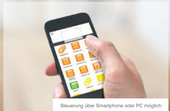
Steuerung über Smartphone oder PC möglich

Kontaktieren Sie uns, wir beraten Sie gern: