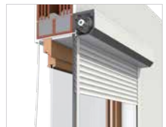
Variante: Linksroller auf der Fassade