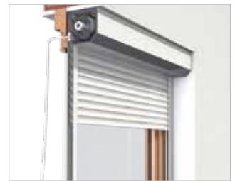
Variante: Linksroller in der Laibung