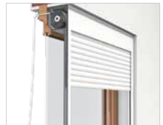
Variante: Rechtsroller in der Laibung