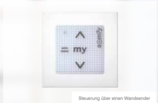
Steuerung über einen Wandsender